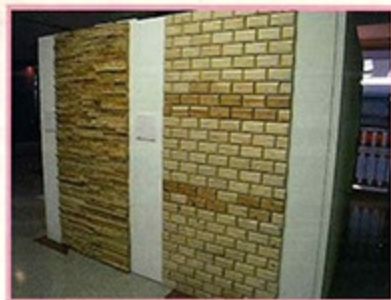
装飾タイル、ポータータイル、 ペブルタイルなど 詳しくは、きつつきHP

「三重の津の木を広めるプロジェクト」として、 津市産の木材を使用した製品「きつつきブランド」の開発、販売のほか 「津の木」を知ってもらうための企画PR活動を行っています。