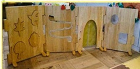
KitoKito遊具 各1セット (津市役所・安濃子育て支援センター) ※こもれびの樹・森のひみつ基地