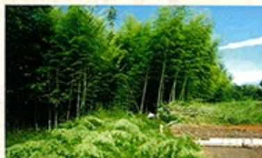
生い茂った竹林もご相談ください!