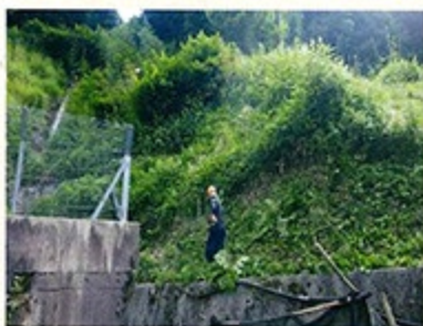
急傾斜地の草刈もお任せください!