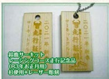
鈴鹿サーキット レーシングコース走行記念品 (R3年お正月用) 杉使用+レーザー彫刻