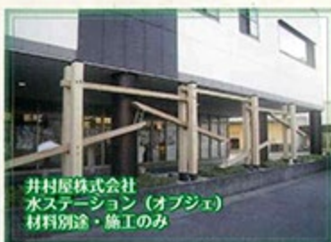
井村屋株式会社 水ステーション(オブジェ) 材料別途・施工のみ