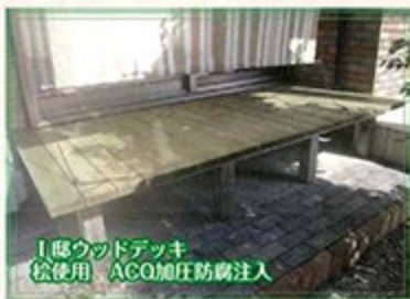
I邸ウッドデッキ 松使用 ACO加圧防腐注入