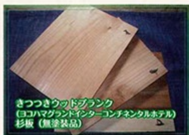
きつつきウッドプランク (ヨコハマグランドインターコンチネンタルホテル) 杉板(無塗装品)