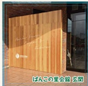
ばんこの里会館 玄関

設置場所に合わせて制作できます。造園用・土木工事用・家庭菜園用ほか各種の杭や円柱製品を用意しています。