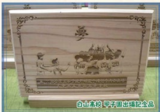
白山高校 甲子園出場記念品