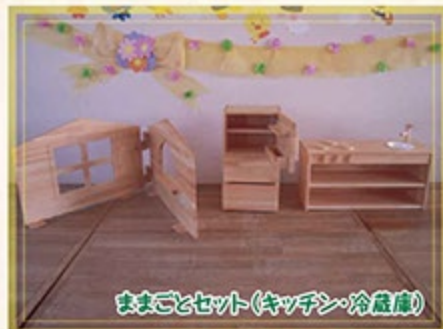
ままごとセット(キッチン・冷蔵庫)