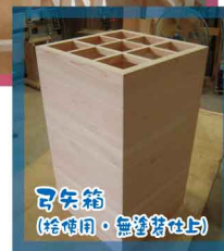
可矢箱 (桧使用・無塗装仕上げ)