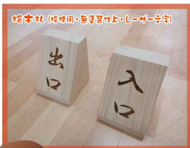
桧木札 (桧使用・無塗装仕上げ・レーザー文字)

3人掛ソファ+アームチェア (応接セット) 桧使用 黒レザー張り 木部ウレタン塗装 津市産業スポーツセンター (サオリーナ待合室納品)