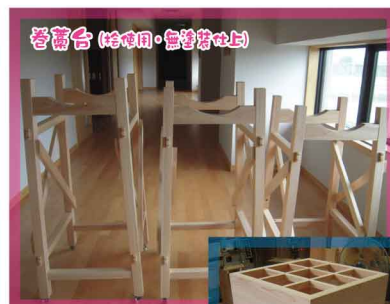
香箱台 (桧使用・無塗装仕上げ)