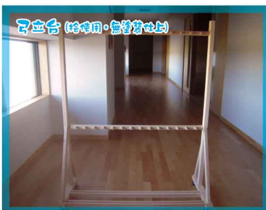
可立台 (桧使用・無塗装仕上げ)