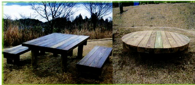
加圧防腐注入剤の木材を使用して作ったテーブル+ベンチ 【青山高原保健休養地公園納品】