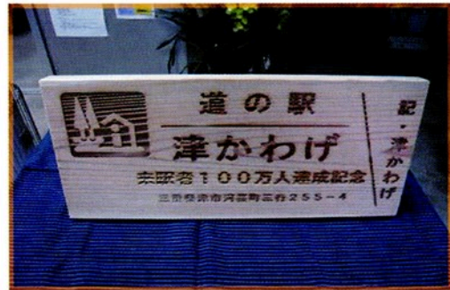
記念キップ 杉板にレーザー彫 道の駅津かわげの記念イベント