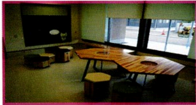
六角型テーブル+椅子

【三重県動物愛護推進センター(あすまいる)納品】 ※テーブルのまん中に透明アクリル板を入れ(取り外し可能)小物収納付です。