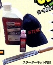
スターキット内容