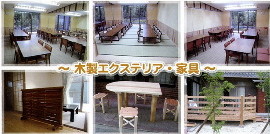
～ 木製エクステリア・家具 ～

中勢森林組合の施工一例です【photo】。自然素材のエクステリア・家具です。経年変化もあり味わいが増し天然素材の良さを感じてください。お客様オリジナルの理想の『ウッドデッキ・塀』などを無料で設計・お見積りいたします。お気軽にお問い合わせください。