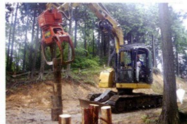
高性能林業機械作業体験 ～津市榊原町地内～