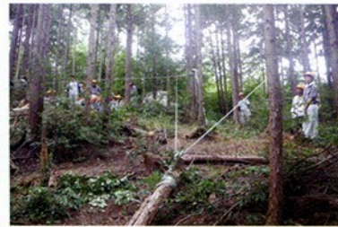
チェーンソーを使って間伐体験 ～津市白山町川口地内～